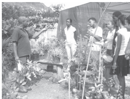
Práctica de campo. Curso NEEDO2.