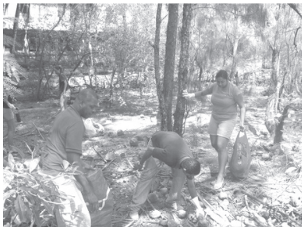
Campaña de limpieza del INE. Curso NEEDO2.

¡Bum! Debe ser el sonido de una bomba. ¡Es tiempo de violencia! ¡Corran todos! ¡Oh!, querida paz Salva nuestras almas de la violencia Ven y ayúdanos a vivir con justicia y armonía